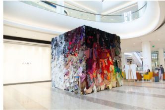
Thiago - Venezia Venezia - Venezia Sostenibilità e Arte

Dal 2014 con il Premio Sostenibilità e Arte, Arte Laguna Prize premia l'arte sostenibile, originale e creativa con l'obiettivo di interessare le comunità locali e internazionali. Arte è così un prezioso mezzo di comunicazione che può farci interpretare dei problemi della società contemporanea . Il mondo creativo degli artisti diventa dunque il motore per la divulgazione di principi ecologici ed etici (promuovendo la sensibilizzazione alle strategie di Risparmio Risorse e sostenibilità) (impugnando l'impugnazione artistica e della creatività per sostenere valori sociali e culturali).