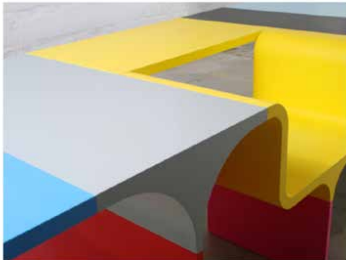
Un particolare del progetto Frankenstein's Bride (2013), premiato a Arte Laguna Prize 2020.

I quattro vincitori si aggiudicano un premio di diecimila euro. Si tratta di un piccolo supporto per ripartire con la creatività e la realizzazione di nuovi progetti.