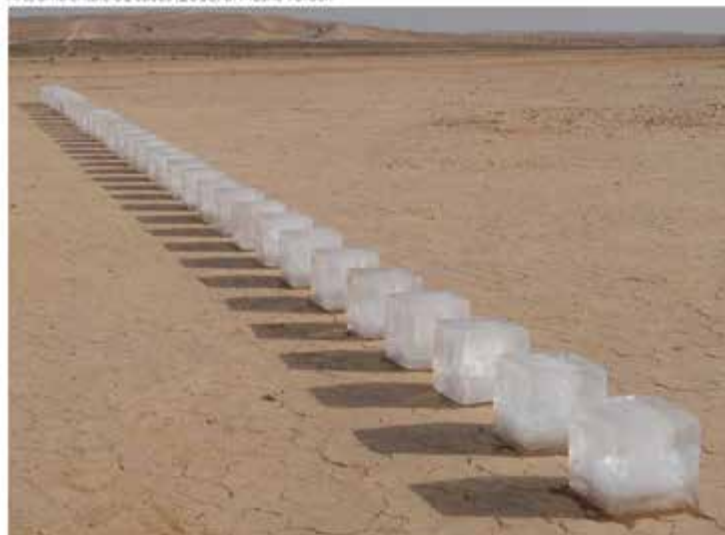
Arte ambientale 31 cubes (2016) di Moshe Vollach

L'artista viene premiato per il suo approccio ossimorico verso la land art, che ha dato vita ad un'opera molto poetica , basata sull'idea di contrasto e su come gli elementi naturali possano lavorare insieme per trasformare l'opera d'arte: una stringa di 61 cubi di dimensioni identiche posti nel deserto in una calda giornata estiva, di cui viene documentato lo scioglimento. L'opera indaga il rapporto tra spazio e materia, trattando temi come il riscaldamento globale, i cambiamenti climatici, lo scioglimento dei ghiacci e la desertificazione.