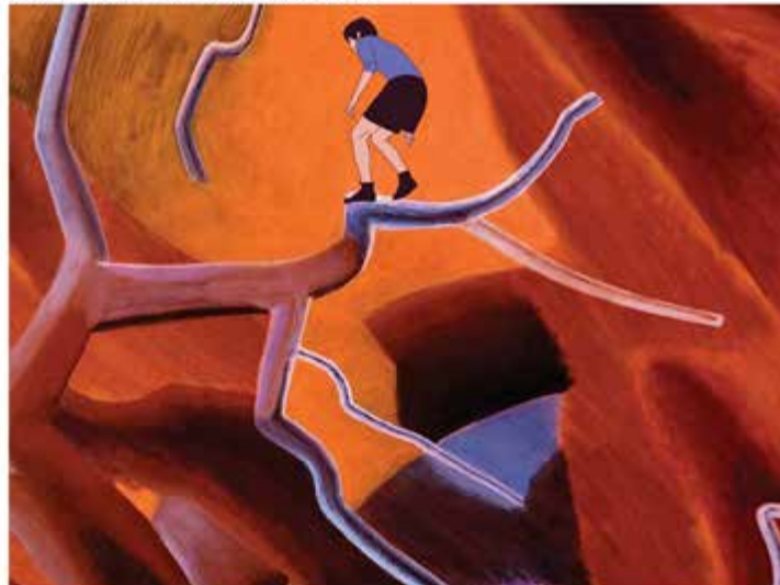
Cloud of the Unknown (2019) dell'artista cinese Gao Yuan

La giuria della sezione Art Design composta da Karel Boonzaaijer , designer, architetto e docente presso l'Università di Scienze Applicate di Aquisgrana e Aldo Cibic , nome fondamentale del design made in Italy nel mondo, ha deciso di premiare Frankenstein's Bride (2013) del designer sloveno Primoz Jeza (Kranj, 1968). Frankenstein's Bride è uno spazio di lavoro versatile e modulare composto da diversi elementi cromatici, un tavolo contemporaneo che può essere adattato per ogni situazione della vita reale.