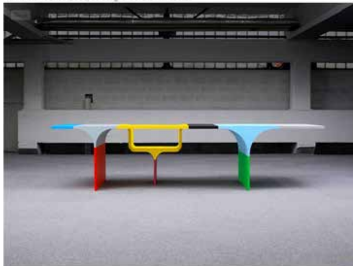
Frankenstein's Bride (2013) del designer sloveno Primoz Jeza

La mostra dei finalisti della 14 a edizione , aprirà al pubblico dal 13 marzo al 5 aprile 2021 all'Arsenale Nord di Venezia assieme ai finalisti della 15 a edizione. Due edizioni di artisti finalisti esporranno in un evento unico con più di 200 opere provenienti da tutto il mondo, un'occasione immancabile per immergersi nell'arte contemporanea internazionale.