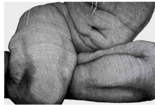
in apertura Tadio Cern, Balloons , 2016